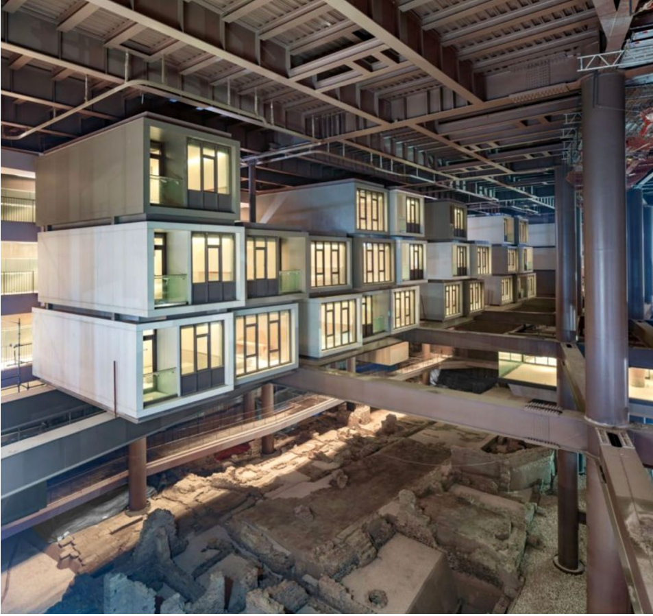
Resim: 6 Şantiyeden görüntü.