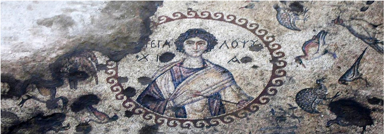
Resim: 5 Kazı alanından örnek.

Yapının ana strüktürü bu şekilde oluşturduktan sonra, EAA'nın son derece cüretkâr ancak bir o kadar da ilgi çekici önerisi devreye girer: otelin kesiti ters yüz edilir. Bu, zeminin pilotilerin üst noktasına taşınması suretiyle, giriş ve bodrum katlarda bulunması zaruri olan otel fonksiyonlarının söz konusu "yeni" zeminin üzerine konumlandırılması anlamına gelmektedir. Ezber bozuculuğu tartışmasız olan bu yaklaşım, mevcut buluntuları içeren orijinal zemin katını kamuya açık bir müze, yeni zemin ve eski zeminin arasında kalan boşlukların ise bir odalar istifi şeklinde kurgulanmasını ön görmektedir. Odalar, prefabrike elemanlarla, konstrüksiyon dışında oluşturulacak ve aralarında buluntuların izlenebileceği açıklıkların bırakılmasıyla yatay bağlantı yolları çevresine yerleştirilir. Söz konusu yatay bağlantı yolları, başka bir deyişle