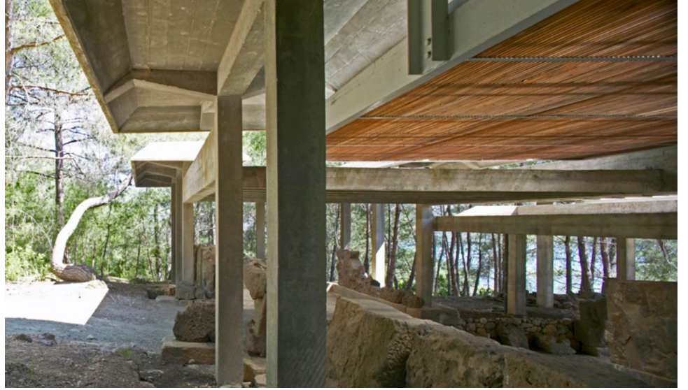
Resim: 4 Pilotiler.

özellikleri serbest bırakır, saçakların izleyici ile özgürleştirici bir ilişki kurmasını sağlar. Zira Bölgeselci mimari kullanıcısıyla doğrudan iletişim kurar. Dağarcığında yere dair veriler barındırdığı için bireyde tanışıklık ve aidiyet hissini kolayca kurabilir. Modernizmin yabancı olma halinin tam zıddıdır ve bu nedenle de hızla benimsenmiştir (Erkol, 2016).