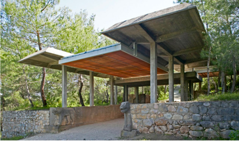
Resim: 1 Hititlerden kalma duvar buluntusunu örten saçaklar. Resim: 2 Kazı Evi.

Karatepe Saçakları, Karatepe Açık hava Müzesi için tasarlanmış bir çeşit üst örtü olarak kabul edilebilir. Müellifinin kim olduğu konusu uzun tartışmaları beraberinde getirmekle birlikte, Aykut Köksal (2016) tarafından yayımlanan Karatepe Saçakları ve Müelliflik Sorunu adlı metinde konuya nokta konur: projenin tasarım müellifi İtalyan Mimar Franco Minissi; projeyi yere uygun biçimde yeniden kotlandırarak uygulama projesini çizen ise Turgut Cansever'dir. Karatepe Saçakları, Cansever'in