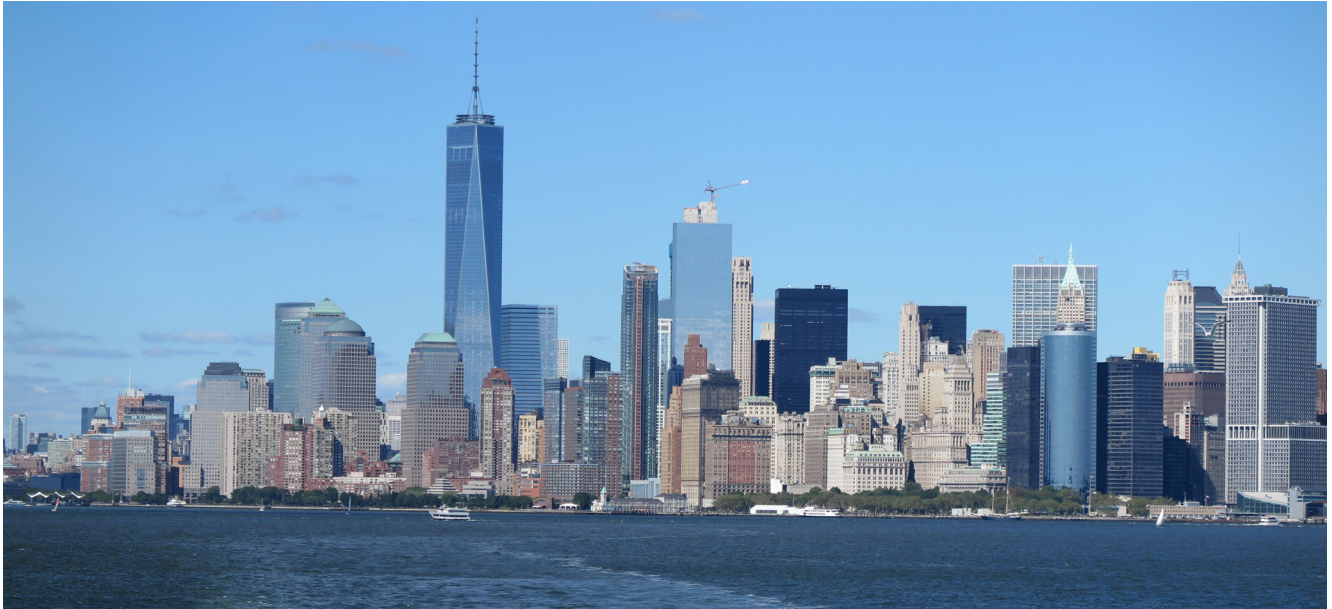
Resim: 2 Manhattan Silüeti, New York (M. Gül, 2016)

Gökdelenler yükseklikleri ve kent merkezlerindeki birbirine yakın konumları ile yapıları çevre ile gökyüzünü ayıran çizgide radikal bir değişime sebep olurlar. Küreselleşme öncesi dünyanın mimari simgelerinin üreticisi olan dini ve siyasi otoritenin rolünü kurumsal sektörün aldığı günümüzde (Sklair, 2006), yüksek yapıların yayılımı sadece Amerika kıtası ile sınırlı kalmamış, aksine bu yapı tipi dünyanın pek çok farklı noktasında kentlerin temsil aracı haline almıştır. Bu süreçte Manhattan adasında yaratılan güçlü imge 20. yüzyıl boyunca dünyanın birçok noktasındaki şehir için rol model olur. Dünya