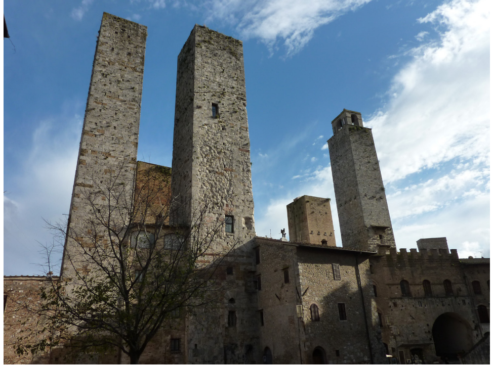
Resim: 1 San Gimignano, İtalya (M. Gül, 2010)

olarak kendileri ile yarışacak başka yapı bulunmaması hakim yapıların, dolayısıyla temsil ettikleri kişi, kurum ya da değerlerin, silüet aracılığı ile kent üzerindeki otoritelerini simgeler. Hakim yapıların hem fiziksel olarak zarar görmeye açık oluşları hem de temsil ettikleri değerlerin kent gündeminde geçerliliğini yitirmesi gibi sebeplerle geçirebileceği değişimler kent silüetlerini dönüşüme açık hale getirir.